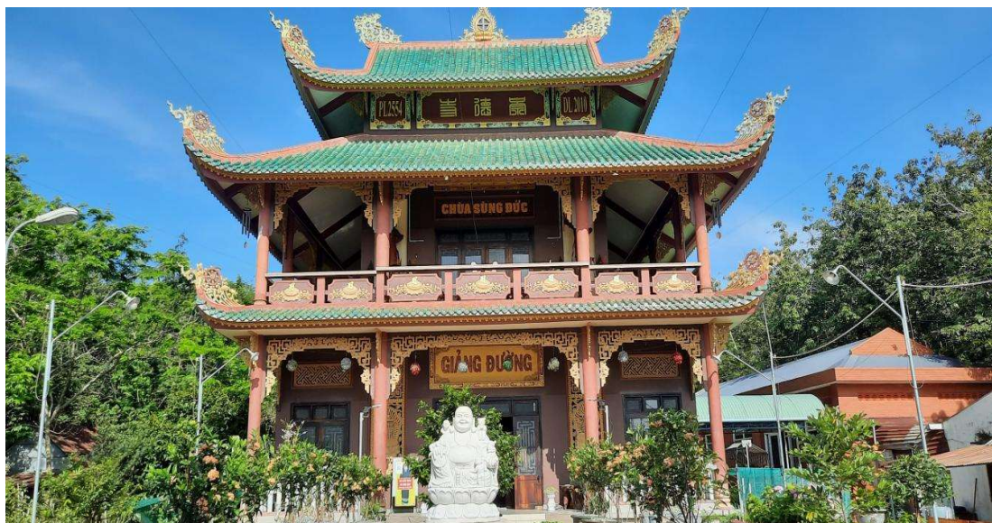
Hình 2. Tượng Phật Quan Âm