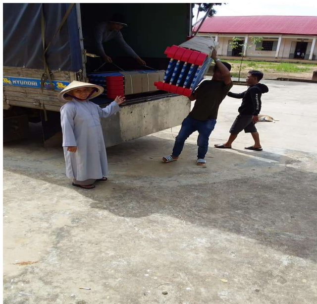
Hin 8. Chùa Sùng Đức ủng hộ bà con các nhu yếu phẩm mùa dịch 2021 (Nguồn: Giáp Thị Lan Hương, 07/12/2021)