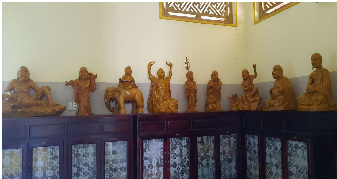
Hình 6. 18 vị La Hán