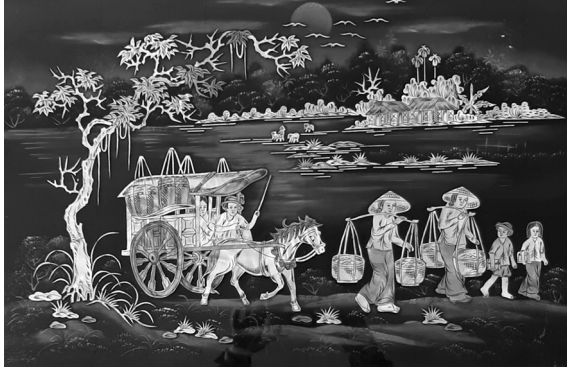
Tranh sơn mài truyền thống. Nguồn: Sơn mài Tây Thi