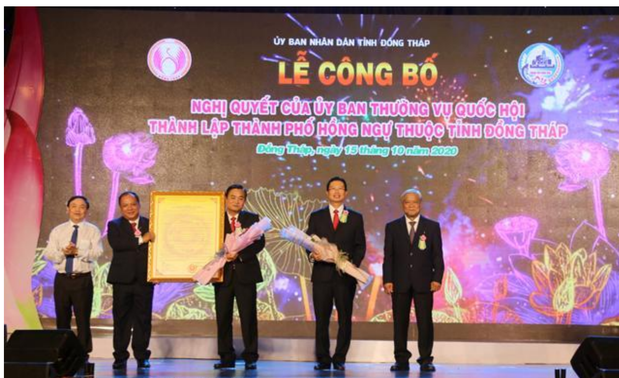
Lễ công bố Nghị quyết của UBTV Quốc hội thành lập Thành phố Hồng Ngự thuộc tỉnh Đồng Tháp.

huyện Hồng Ngự. Thị xã Hồng Ngự gồm 3 phường trung tâm: An Thạnh, An Lạc và An Lộc với 4 xã Tân Hội, Bình Thạnh, An Bình A và An Bình B. Trung tâm hành chính thị xã đặt tại phường An Thạnh. Huyện Hồng Ngự có 11 xã: Long Khánh A, Long Khánh B, Long Thuận, Phú Thuận A, Phú Thuận B, Thường Lạc, Thường Phước 1, Thường Phước 2, Thường Thới Hậu A, Thường Thới Hậu B, Thường Thới Tiền [7, 46]. Đáng lưu ý là huyện Hồng Ngự chưa có thị trấn, các cơ quan chính quyền huyện đặt trên địa bàn xã Thường Thới Tiền. Đến ngày 10-01-2019, Ủy ban Thường vụ Quốc hội ban hành Nghị quyết số 625/NQ-UBTVQH14, điều chỉnh địa giới hành chính xã Thường Thới Tiền và xã Thường Phước 2 thuộc huyện Hồng Ngự, thành lập thị trấn Thường Thới Tiền. Và, ngày 18-9-2020, Ủy ban Thường vụ Quốc hội ra Nghị quyết số 1003/NQ-UBTVQH14, thành lập phường An Bình A, phường An Bình B [từ hai xã cùng tên, TG] và thành phố Hồng Ngự [từ thị xã Hồng Ngự, TG] thuộc tỉnh Đồng Tháp. Hiện nay, vùng đất Hồng Ngự bao gồm ba đơn vị hành chính: Thành phố Hồng Ngự, huyện Hồng Ngự và huyện Tân Hồng, tỉnh Đồng Tháp.