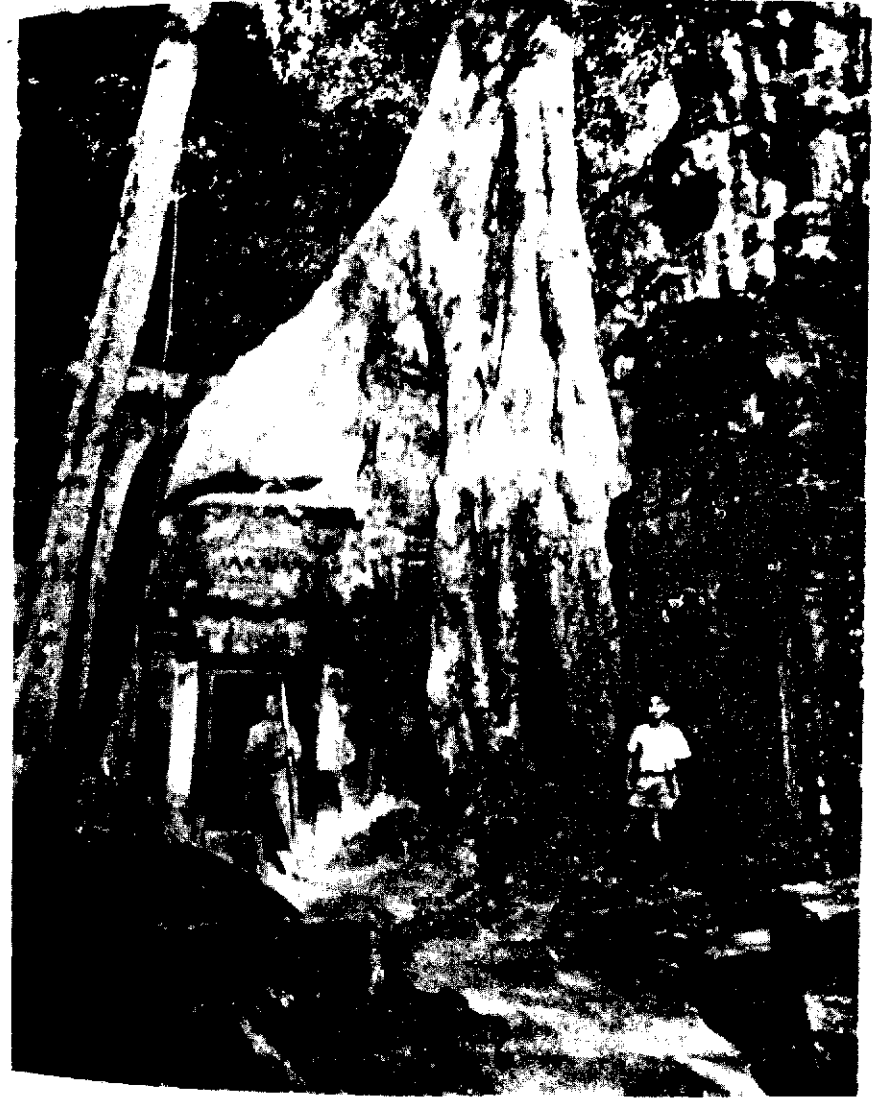
Đền Angkor Thom chìm trong rêu đại thụ

Qua cửa Angkor Vat tôi thấy vài người chỉ dẫn quần áo chỉnh tề đợi du khách ở trước nhà cho mượn voi. Chúng tôi đi thẳng đến núi Bakheng, cách cửa tây đền Angkor Vat độ 1500 thước và cửa nam thành Angkor Thom độ 500 thước.