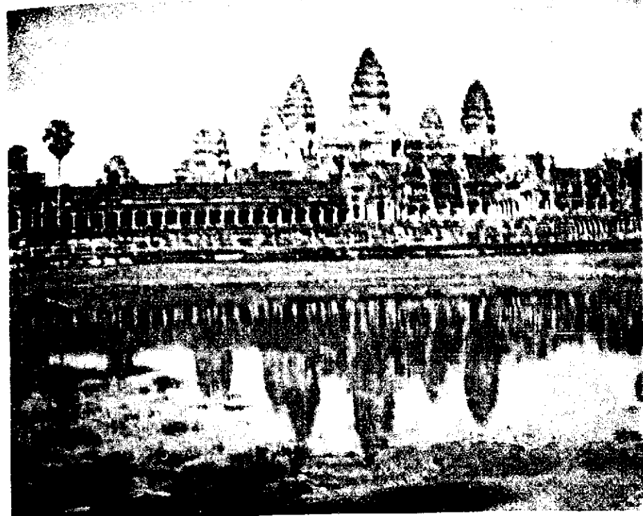
Toàn cảnh Angkor